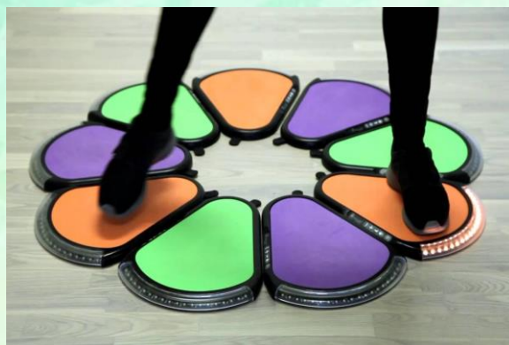
智能運動板及互動投影系統