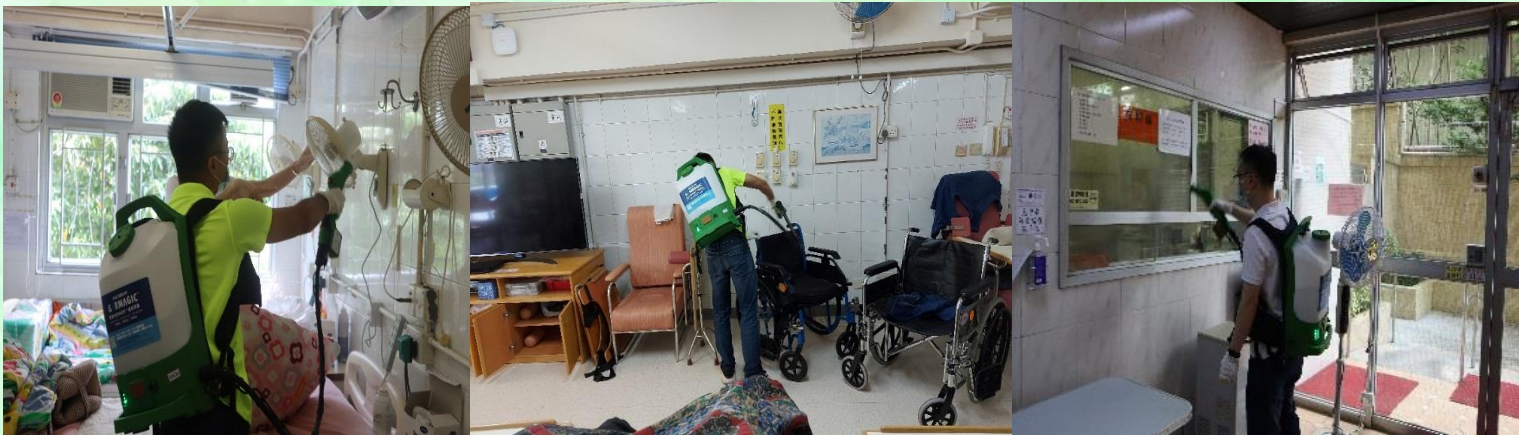
全院範圍噴灑長效消毒塗層